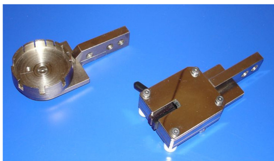
2 systèmes de clampage disponibles